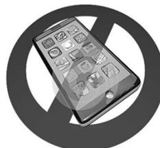
Prohibido teléfonos móviles