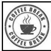
Pausas para café e instalaciones